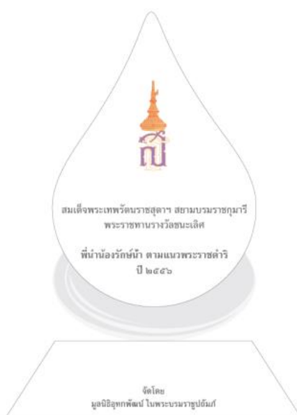
ภาพตัวอย่างโล่รางวัลพระราชทาน